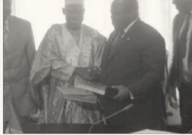
Échange de documents entre le MINFI et le directeur de BGFI banque Cameroun.

En rappel, BGFI finance déjà à hauteur de 100 milliards de FCFA, tous jours dans le cadre des CAN 2016 et 2019, la réhabilitation des voies secondaires et l'éclairage public dans les villes de Yaoundé et Douala, dans le cadre du Plan d'urgence triennal. Le stade de Douala-Japoma qui bénéficie de ce financement de BGFI sera construit par le consortium composé d'une société turque, Yenigun et d'une entreprise américaine, AFLC/AECOM. Un marché a été attribué le 31 décembre 2015 par le ministre des Marchés publics